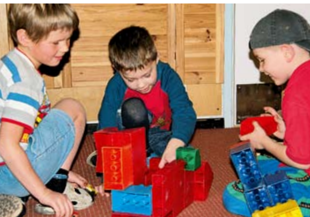
Gleiche Chancen für alle Kinder