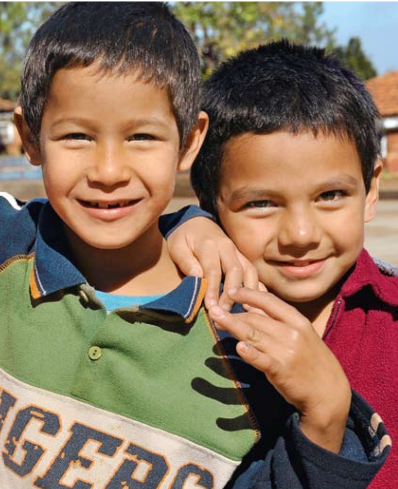
Zwei Jungen freuen sich über ihr Zuhause im SOS-Kinderdorf Hohenau/Paraguay.