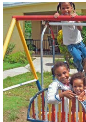
Auf dem Spielplatz im SOS-Kinderdorf Santiago de los Caballeros/ Dominikanische Republik

Wir danken Ihnen im Namen der SOS-Kinder für Ihre Unterstützung!