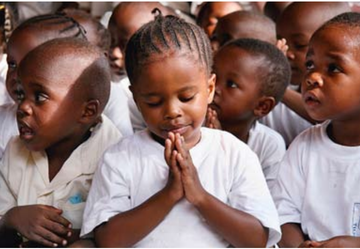
Kinder im SOS-Kinderdorf in Mombasa