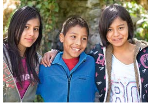
Jugendliche im SOS-Kinderdorf Mexiko-Stadt