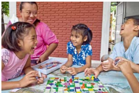
SOS-Kinder und ihre SOS-Kinderdorf-Mutter spielen im SOS-Kinderdorf Bangkok/Thailand.