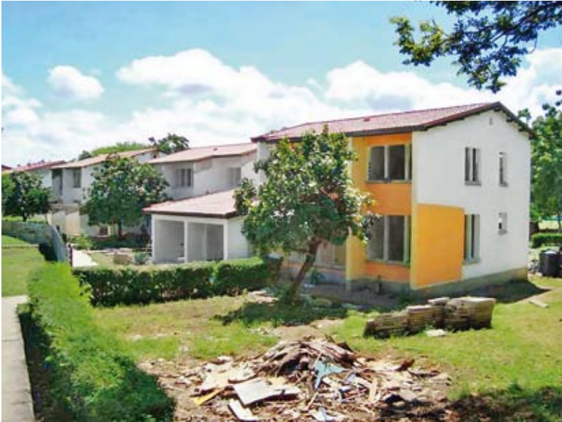
Nach Abschluss der Renovierungs- und Erweiterungsarbeiten werden 30 weitere Kinder hier im SOS-Kinderdorf Mombasa/Kenia ein neues Zuhause haben.