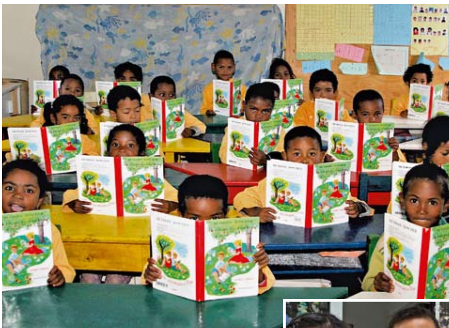
Kinder lernen in der SOS-Schule in Antsirabe/Madagaskar