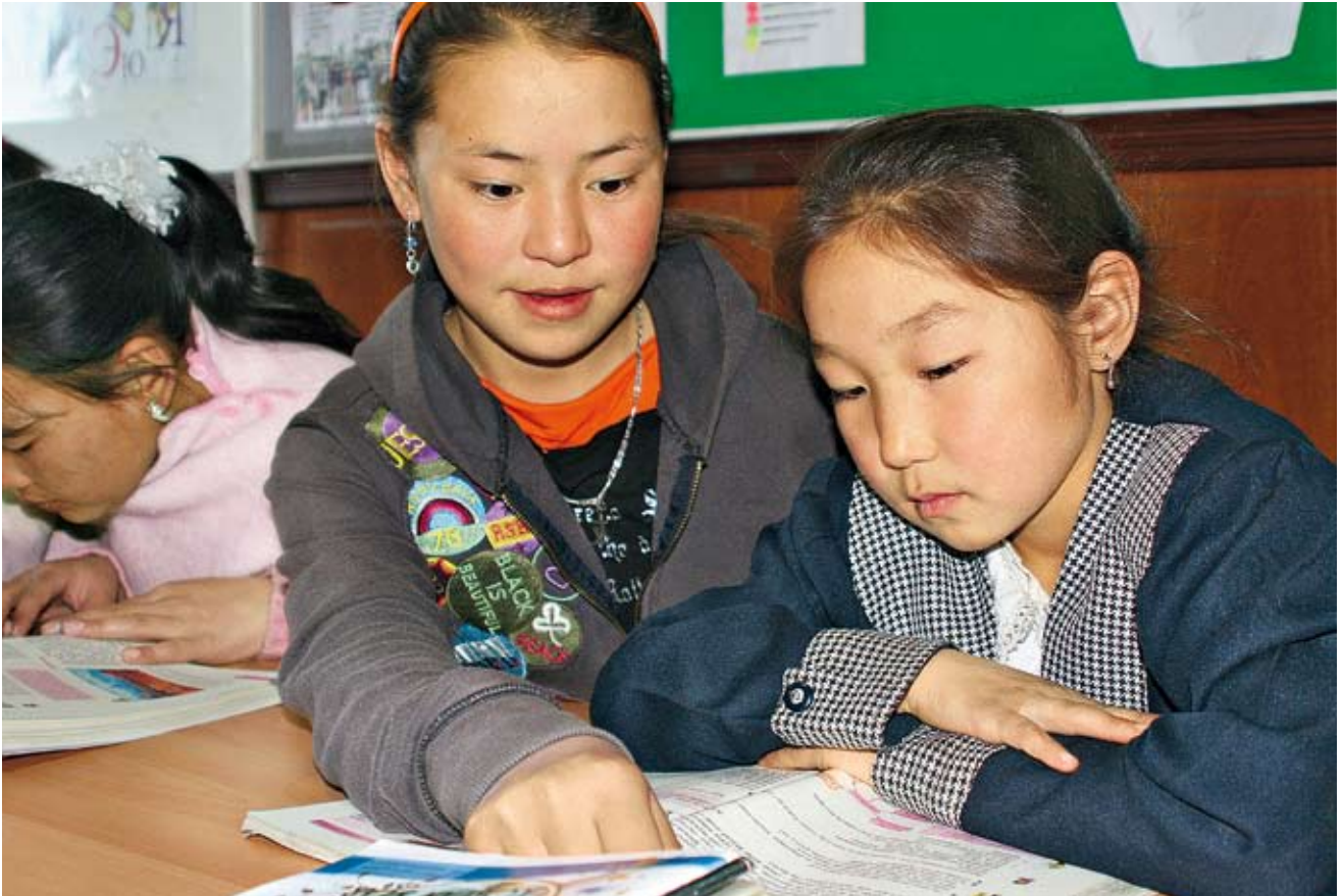
Lernen für ein besseres Leben: Die Kinder ehemaliger Nomaden werden im SOS-Sozialzentrum Ulan Bator/Mongolei auf die Schule vorbereitet.