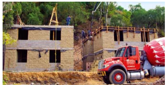
Die Häuser wurden erdbebensicher und nach ökologischen Kriterien gebaut.

Mehr: www.sos-kinderdoerfer.de/mexico-city