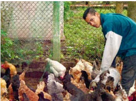
Die Ausbildung zum Landwirt im SOS-Ausbildungszentrum Armero/Kolumbien ist Basis für ein Leben in Selbständigkeit und dient der Entwicklung der Gemeinde.