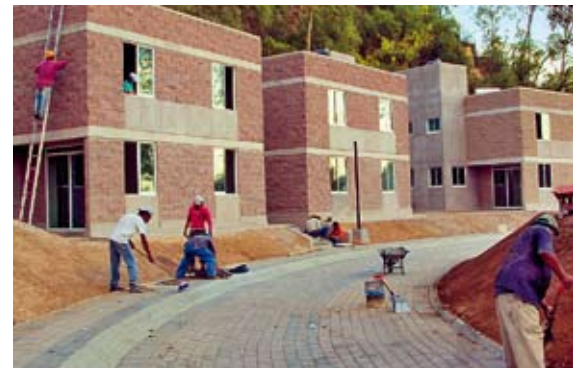
Nach 40 Jahren war eine umfassende Erneuerung des SOS-Kinderdorfs Mexiko-City dringend erforderlich.