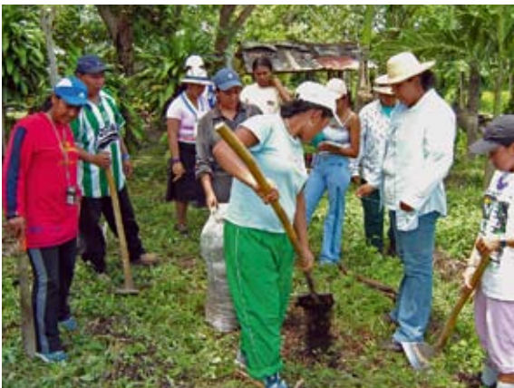
Im SOS-Ausbildungszentrum Armero werden Jugendliche zu Landwirten ausgebildet.

Seit Jahren ist Landflucht in Kolumbien ein großes Problem. Städte wachsen schnell und unkontrolliert, ländliche Regionen verwaisten. Um dem entgegenzuwirken und Jugendlichen auf dem Land eine Perspektive zu eröffnen, hat SOS vor über 20 Jahren in Armero ein Ausbildungszentrum eröffnet. Hier können 50 Jugendliche pro Jahr eine umfassende landwirtschaftliche Ausbildung durchlaufen. In der 18 Monate dauernden Lehre erfahren die angehenden Landwirte alles über ökologische landwirtschaftliche Produktion, wie man einen landwirtschaftlichen Betrieb führt und verwaltet, Produktionsabläufe organisiert und schließlich die eigenen Produkte vermarktet. Die jungen Männer und Frauen lernen zudem, soziale Verantwortung zu übernehmen. Nach Abschluss der Ausbildung haben sie nicht nur das nötige Rüstzeug, um sich selbst eine Existenz aufzubauen. Sie unterstützen auch bedürftige Familien in ihrer Nachbarschaft, indem sie ihr fundiertes Wissen an sie weitergeben und bei der praktischen Umsetzung mithelfen: Gemüsegärten werden gemeinsam angelegt, Saatgut und Nutztiere angeschafft. Die Familien sind so künftig in der Lage, für sich selbst zu sorgen. Damit ist der erste Schritt aus Armut, Not und Perspektivlosigkeit getan. So leisten die Absolventen des SOS-Ausbildungszentrums in Armero einen wichtigen Beitrag zur Verbesserung der sozialen Situation in ihren Gemeinden.