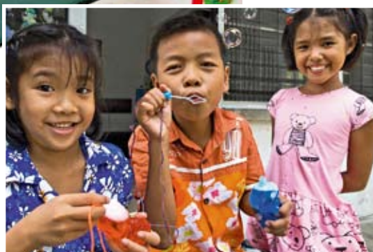
Seifenblasen im SOS- Kinderdorf Bangkok/Thailand