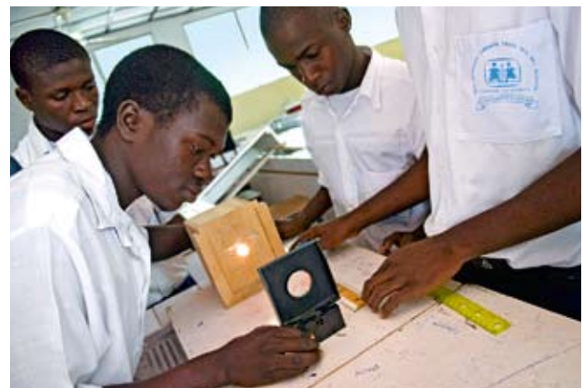
Die umfassende und praxisorientierte Lehre verbessert die Chancen auf dem Arbeitsmarkt.

Die Ausbildung dauert drei Jahre und schließt mit einer staatlich anerkannten Prüfung ab. Mit dem Zeugnis haben die Absolventen beste Chancen auf einen Arbeitsplatz und auf ein selbständiges Leben.