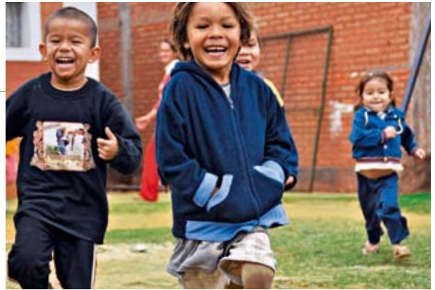
Spielende Kinder der SOS-Familienhilfe in Paraguay