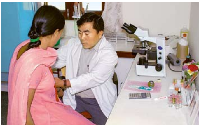
Hilfe und Vorsorge im SOS-Medizinischen Zentrum Bardiya