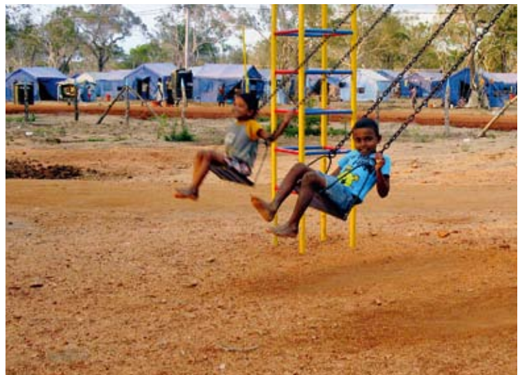
Unbegleitete Flüchtlingskinder finden im SOS-Camp Chettikulam/Sri Lanka Schutz, Essen und Hoffnung, wieder mit ihren Familien vereint zu werden.