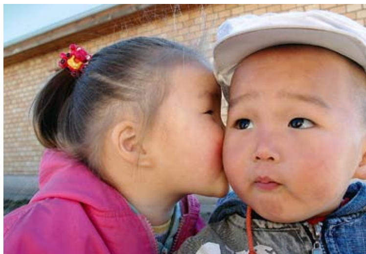
Vor allem Kinder profitieren von der SOS-Familienhilfe.