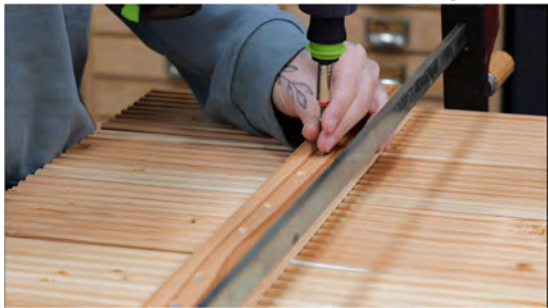
1. Anzeichnen, vorbohren und versenken