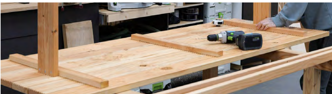
2. Mit der Tischplatte verschrauben