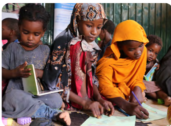
Die SOS-Kinderdörfer Somalia schaffen sichere Orte für Spiel und Entwicklung.

Dieser Bericht zeigt, wie Ihre Hilfe in konkreten Krisenregionen ankommt und wirkt.