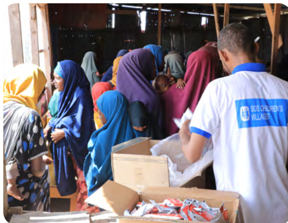
Die Soforthilfe der SOS-Kinderdörfer Somalia erreicht Familien in akuter Not.